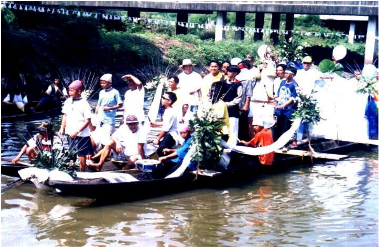
Neng daratang ing fiestang parokya balang October 7, anti kaniti ing magaganap a LIBAD king ilug ketang panaun nang Among Lauds H. Mangune.