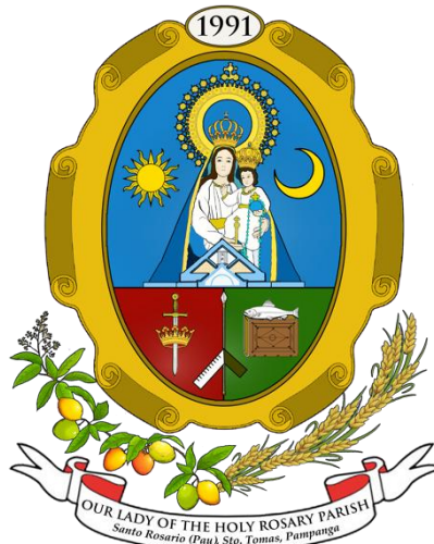
Ing bayung Escudo de Armas ning Parokya

Inumpisan ne rin pagawang Among Jowel Gatus ring misusumangid a retablo ning Altar. Ding adwang malating retablo o “Retablo Menor” ding magsilbing regalal at tanda ning kapasalamatan da ring parokyanus para king ka-30banwang Anibersaryo ning Parokya at ka-500 a banwang Anibersaryo ning Kristyanismu king Pilipinas.