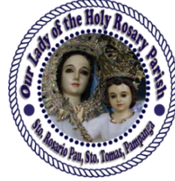
Ring milabas a Parish Logo a megamit kanita king Our Lady of the Holy Rosary Parish